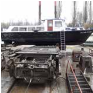
Aufgrund eines Wasserschadens war die Wichern zur Reparatur in einer Speyerer Werft.

Den Gottesdienst der Binnenschiffer feiern wir am 26. Mai um 11:00 Uhr in der Hafenkirche gemeinsam mit der niederländischen Skipper-Pastoral und dem Schifffahrtsverein. Dabei ist auch wieder wie in jedem Jahr das Posaunenensemble Feudenheim. Herzliche Einladung dazu! ar