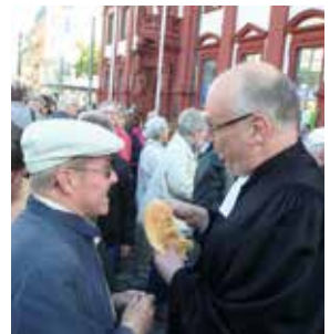
„Meile der Religionen“ bleibt wichtiges Zeichen für ein tolerantes Miteinander in der Stadt Mannheim.