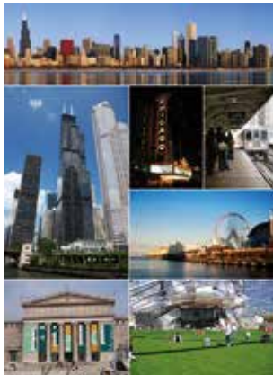
ESG besucht die Stadt mit den vielen Gesichtern: Chicago

Sonntags abends 19:00 Uhr feiern wir Gottesdienste in der Hafenkirche mit Nearby H(e)aven .